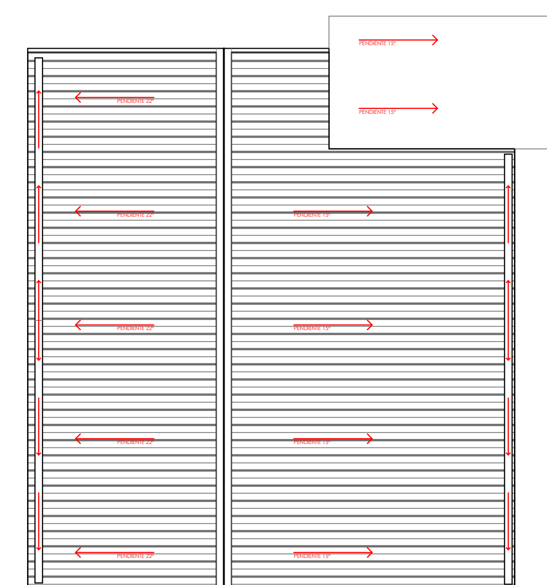
PLANTA CUBIERTAS esc 1:100

*Nota: Todas las dimensiones deberan ser rectificadas en terreno